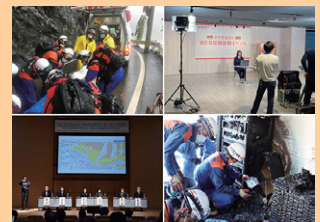
■ 表紙 本号掲載記事より