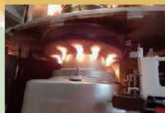
異常燃焼が火災に発展した石油ストーブの構造不具合に関する調査報告