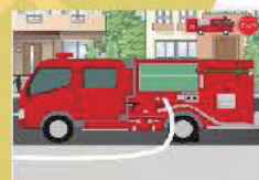
消防団ポンプ車訓練シミュレーター~安全で確実な送水を当たり前のものにするために~