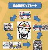
救急KYTシートの開発